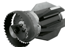
CORTA RAÍCES DE SIERRA