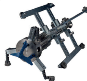
CORTA RAÍCES GRANDE