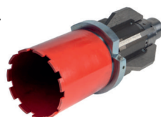
FRESA DE CORONA